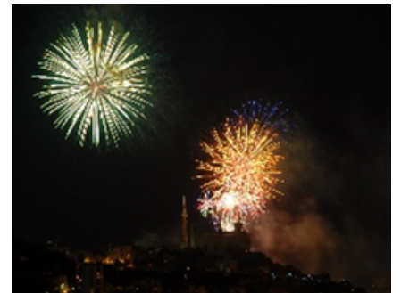
23h : Feu d'artifice